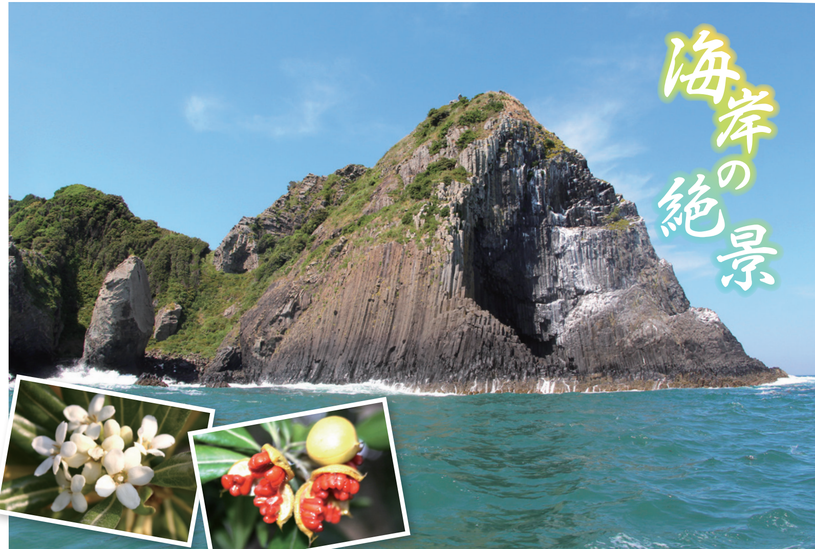
撮影場所: 福岡県糸島市・芥屋大門とトペラ