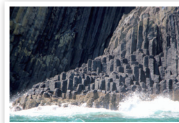
福岡県「芥屋の大門」

福岡県では糸島の「芥屋の大門」が有名です。柱状節理の断崖に加えて、玄界灘からの荒波の侵食によってできた海食洞が絶景……。日本三大玄武洞の中でも、最大級のものと言われています。火山が多い日本列島ですので、各地に柱状節理による景観が見られます。その例として、北海道にある「天人峡」の岩壁、岐阜の「唐谷滝」を示します。