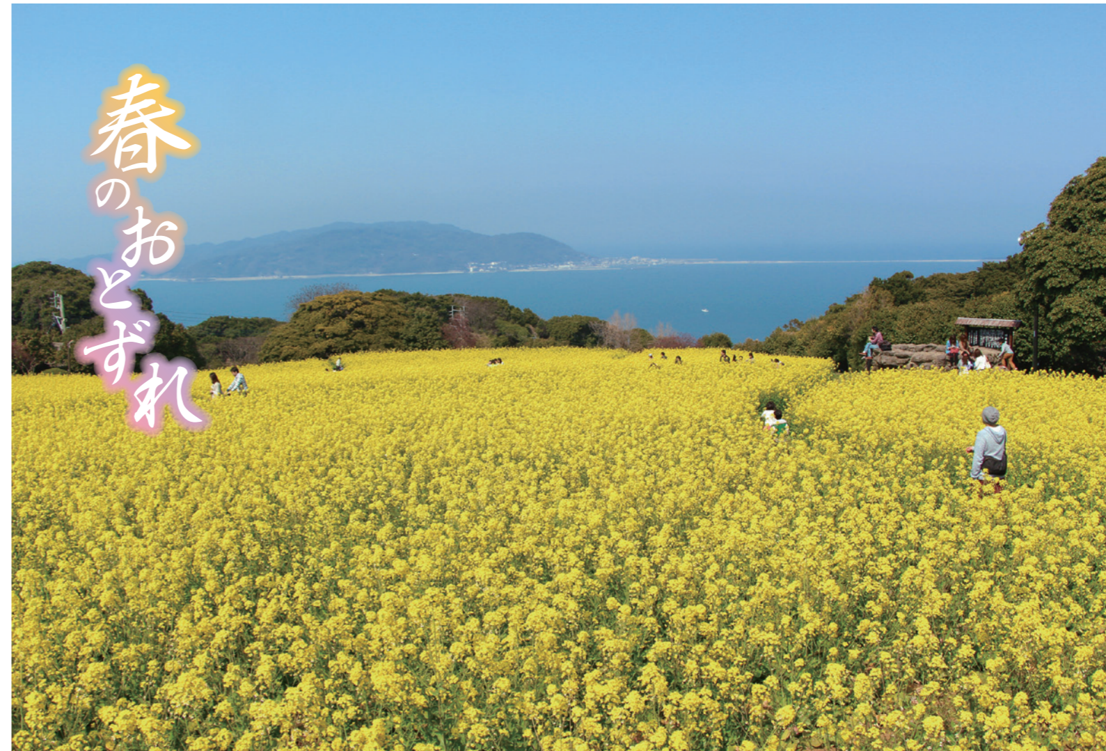
撮影場所: 福岡市・このしまアイランドパーク