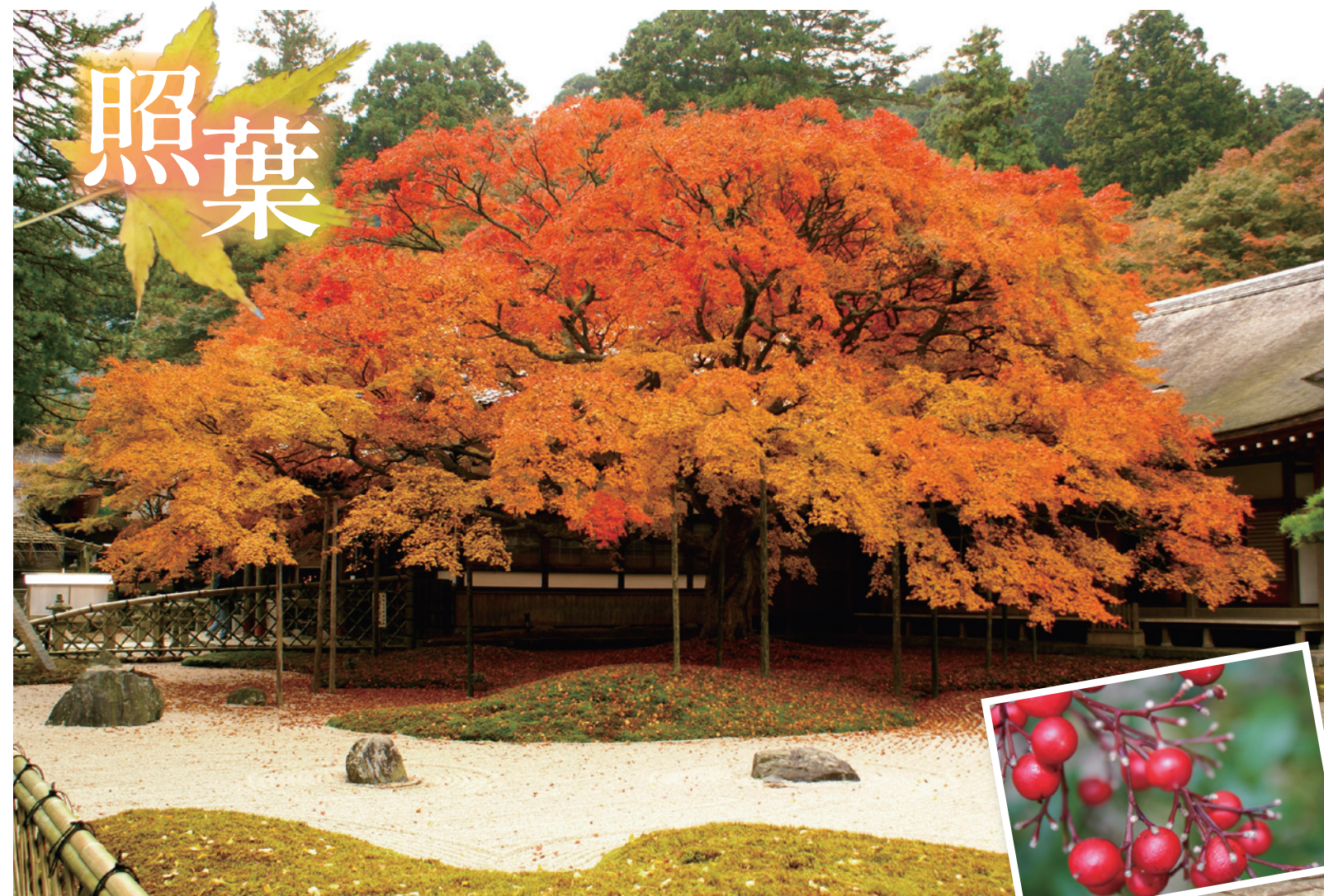
撮影場所：福岡県糸島市雷山・雷山千如寺大悲王院