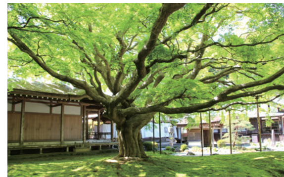
新緑期の大楓と木洩れ日の苔庭

庭園も有名です。客殿の前にある庭は、美しい砂紋の和庭園で、その中に樹齢が約400年の大楓があり、県の指定天然記念物となっています。この樹に四季が訪れ、各季節を通じて様々な姿を見せてくれます。とくに秋の紅葉期は有名。四方に伸びる枝に繁る葉は真っ赤に色づき、根元の周りにびっしりと生える緑苔が、紅葉を引き立てます。また春の新緑期には、若葉色のカエデの葉と根元の緑苔が一体化します。また千如寺の境内には多くの花や実が、それぞれの季節を彩っています。